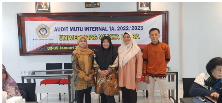
Gambar 1.2 Kegiatan Audit Mutu Internal