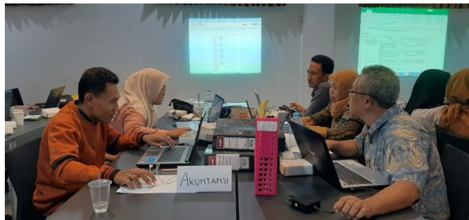
Gambar 1.1 Kegiatan Audit Mutu Internal.